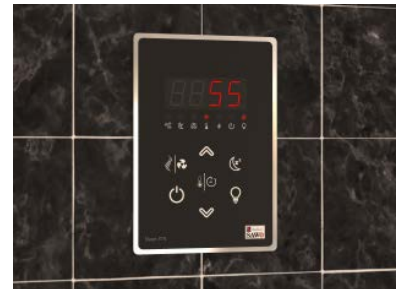
STN- Classic 2.0 - Ohjain (Höyrystimille)