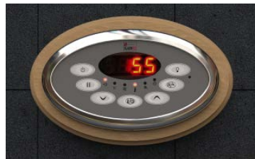
Classic - Ohjain (Höyrystimille)