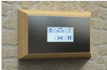
Stainless Steel Touch - Ohjain (Höyrystimille)